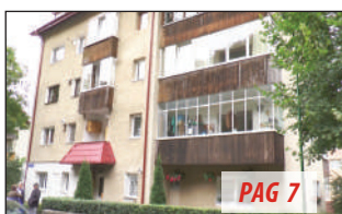
Bloc din Răcădău, evacuat