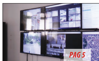
Brasovul este Smart City