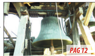
Moment istoric la Biserica Neagră