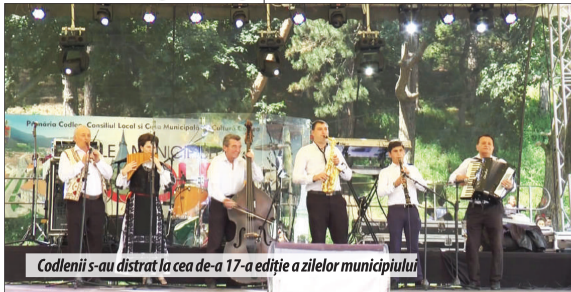
Codlenii s-au distrat la cea de-a 17-a ediție a zilelor municipiului

„Avem un buget care ne permite să facem investiții majore pentru municipiul nostru. Un buget în creștere. Dorim ca în buget, suma prevăzută pentru investiții să fie considerabil mai mare după atragerea fondurilor externe, fie că este vorba de fonduri guvernamentale sau europene, sperăm să fie și asemenea fonduri. A fost făcută predarea de amplasament pentru construcția a două săli