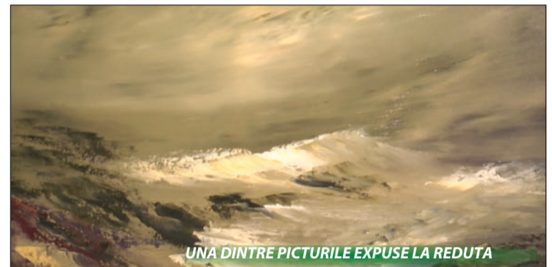
UNA DINTRE PICTURILE EXPUSE LA REDUTA