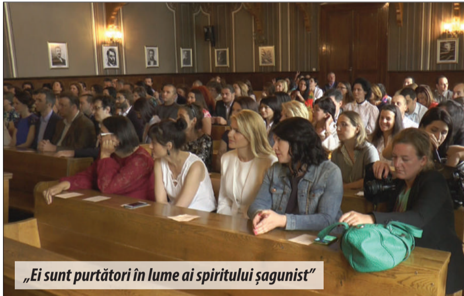
„Ei sunt purtători în lume ai spiritului șagunist”

Au urmat discursuri emoționante și s-au depănat amintiri. „Întâmpinăm întotdeauna cu emoție și cu deosebită bucurie întâlnirea cu absolvenții noștri. Ei sunt purtători în lume ai spiritului șagunist”